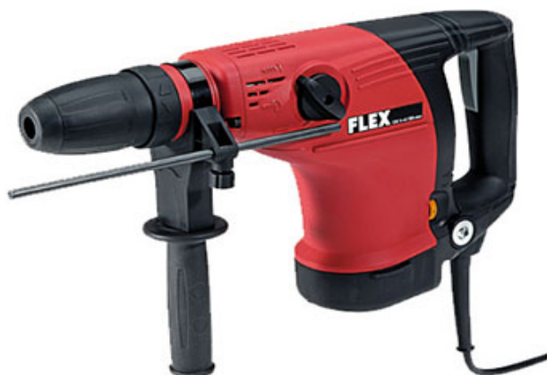
CHE 5-45 SDS Max

Conceptrice dans les années 1920 de la meuleuse haute vitesse, la société Flex possède un savoir-faire important dans le domaine du ponçage et est d'ailleurs renommée pour ses ponceuses à bras, au point que le nom de sa machine emblématique, la Giraffe, est quasiment rentré dans le langage commun pour indiquer ce type d'appareil. La marque possède par ailleurs un vaste programme béton et pierre avec une gamme complète de machines et accessoires.