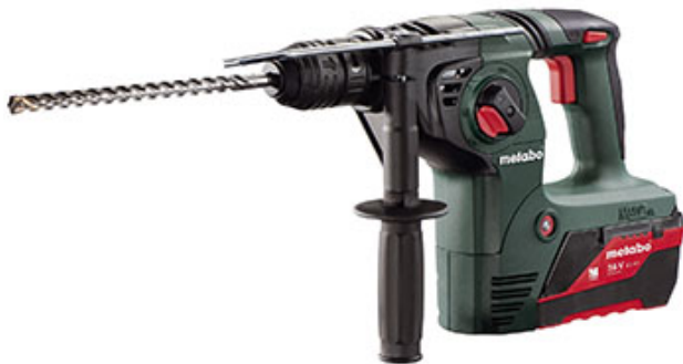
KHA 36 LTX

Racheté il y a deux ans par le fonds Chequers Capital, Metabo est un fabricant d'outillages électroportatifs généraliste avec dans sa gamme deux points forts qui sont le travail du métal et la construction. Elle est actuellement plus implantée dans le marché grand public (2/3 du CA) que professionnel mais suit une stratégie de rééquilibrage entre ces deux circuits, notamment en sortant actuellement de nombreuses nouveautés essentiellement dédiées au marché professionnel.