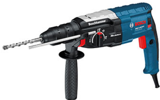
GBH 2-28 DFV Professional