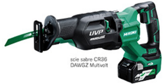
scie sabre CR36 DAWGZ Multivolt

La lame pour scie circulaire Black Orca relève d'une haute technologie avec un ensemble d'éléments destinés à améliorer ses capacités. Ainsi, cette lame de 165 mm dotée de 45 dents à plaquette de carbure de tungstène a été traitée au fluor (fluoration) pour assurer une fluidité de coupe améliorée ainsi qu'une plus longue durée de vie. La performance de coupe est également augmentée par l'inclinaison de 30° des plaquettes, en alternance à gauche et à droite, enchaînement interrompu toutes les cinq dents par une plaquette de stabilité non inclinée. Cette cinquième dent est également d'une forme spécifique pour faciliter l'évacuation des copeaux.