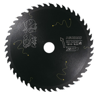
lame pour scie circulaire Black Orca

Pour les machines, Hikoki a sorti de nombreux modèles parmi lesquels le cloueur de charpentier NR1890 DBCL brushless compatible Multivolt qui pose des clous tête D 34° d'une longueur de 50 à 90 mm (fil 2,9 à 3,3 mm) conditionnés en bande papier. Il est doté d'un système d'entraînement par air comprimé (autonomie de la chambre de 10 000 clous minimum) et peut tirer en mode séquentiel comme en mode rafale. La capacité de tir est de 700 coups avec une batterie 18 V 5.0 Ah. D'autres modèles sont également disponibles pour les travaux de finition avec une batterie 3.0 Ah en brads droits 16 GA 25-65 mm x 1,65 mm (1 500 tirs par charge) et minibrads droits 18 GA 15-50 mm x 1,25 mm (1 600 tirs par charge).