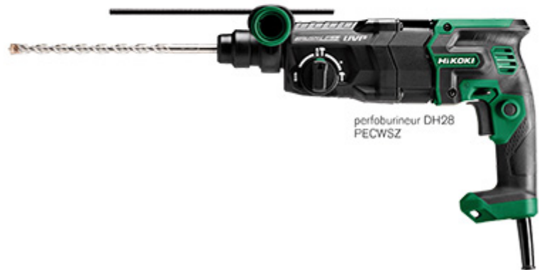
perforateur DH28 PECWSZ

Pour les machines, Hikoki a sorti de nombreux modèles parmi lesquels le cloueur de charpentier NR1890 DBCL brushless compatible Multivolt qui pose des clous tête D 34° d'une longueur de 50 à 90 mm (fil 2,9 à 3,3 mm) conditionnés en bande papier. Il est doté d'un système d'entraînement par air comprimé (autonomie de la chambre de 10 000 clous minimum) et peut tirer en mode séquentiel comme en mode rafale. La capacité de tir est de 700 coups avec une batterie 18 V 5.0 Ah. D'autres modèles sont également disponibles pour les travaux de finition avec une batterie 3.0 Ah en brads droits 16 GA 25-65 mm x 1,65 mm (1 500 tirs par charge) et minibrads droits 18 GA 15-50 mm x 1,25 mm (1 600 tirs par charge).