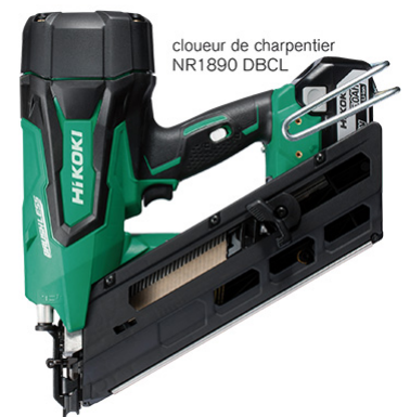
cloueur de charpentier NR1890 DBCL

Toujours en sans-fil, on peut également noter la scie sabre CR36 DAWGZ Multivolt de grande puissance. Elle est dotée d'une course de 32 mm et de quatre vitesses de fonctionnement de 1 700 à 3 000 mvt/min pour des capacités de coupe de 300 mm dans le bois, 130 mm dans les tuyaux en acier et de 19 mm dans l'acier plein. Elle bénéficie du système anti-vibration UVP.